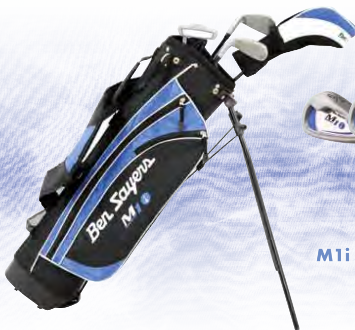
M1i Junior Set Blue (Alter 9-11 Jahre)