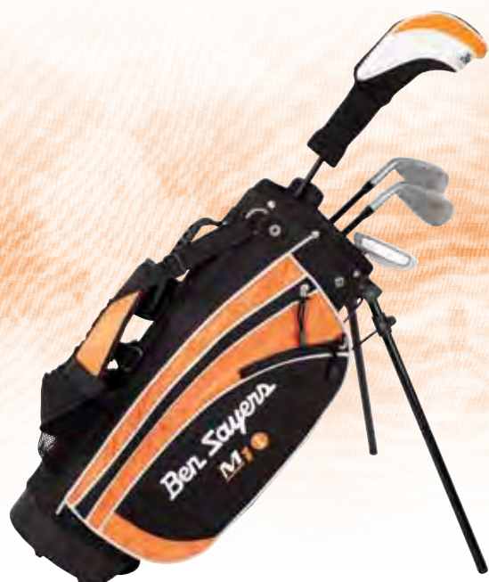
M1i Junior Set Orange (Alter 5-8 Jahre)