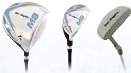
LADIES HALBSET (SkyBlue)