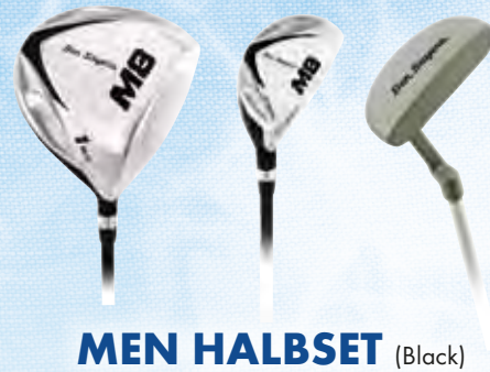
MEN HALBSET (Black)